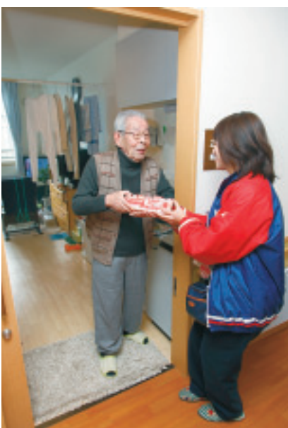
販売員が部屋まで届けてくれます