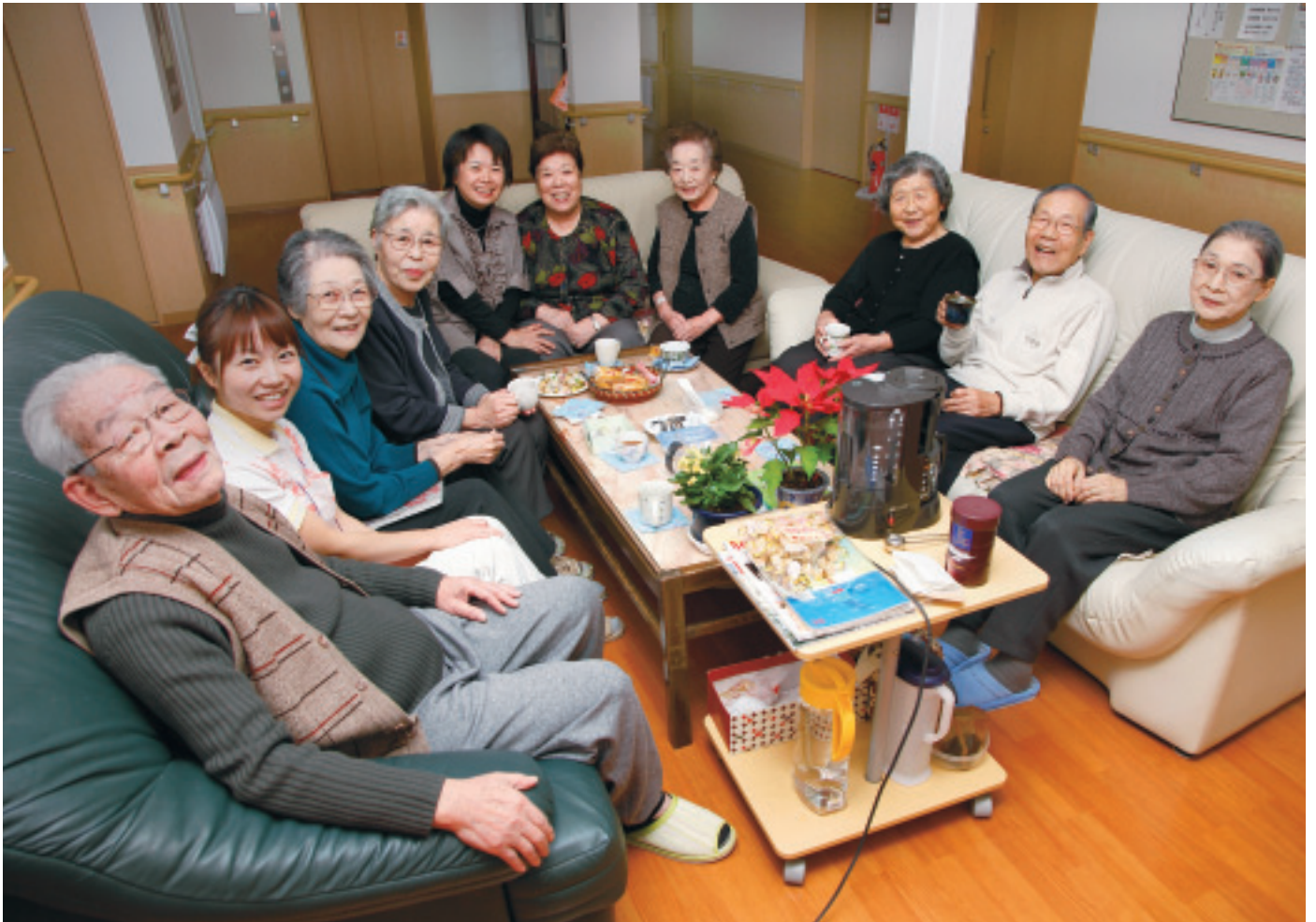
「モーニングコーヒーの会」のみなさん。朝のひとつき、話に花が咲きます…

高齢になれば、心配なことは山ほど出てきます。病気のこと、介護のこと、そして住まい。北海道勤労者在宅医療福祉協会（以下、勤医協在宅）は、高齢者住宅づくりに力を入れています。これも「安心して住みつつけられる地域・まちづくり」の一端を担う、民医連らしいとくみです。そのうちのひとつ、札幌市清田区の高齢者専用賃貸住宅（高専賃）「水芭蕉」（40室・定員42人）を訪ねました。