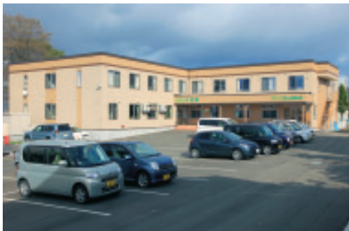
「水芭蕉」とデイサービス「さんぼみち」

厚労省が管轄する特養などとは違い、「高専賃」の所管は国交省。「設置運営指導指針」も緩やかなため、物件の規模や質などはさまざまです。また、介護サービスは義務づけられていないため、基本的に個々の入居者が外部の居宅サービス事業者と個別に契約しなければなりません。