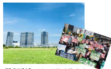
関東近郊では5.3憲法集会として馴染みが深い公園

地震発生後72時間をどう過ごすか学ぶ「東京直下72hTOUR」や防災についての展示など、災害時に生き抜く知恵を学ぶ施設となっています。売店では避難用リュックに備えておきたい防災グッズも販売。体験は無料ですが、団体の場合は予約が必要となりますのでご注意ください。