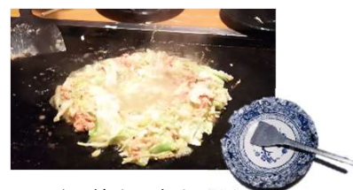
もんじゃ焼き。小さなへら（ハガシ）を使って食べる

路地裏の沢山ある地域なので、ふらりと足の向くままお散歩も楽しんでみてはいかがでしょうか。