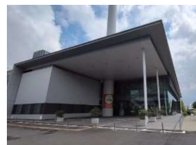
そなエリア東京（正面玄関） 「シン・ゴジラ」の撮影で使われた指令室が見学できる