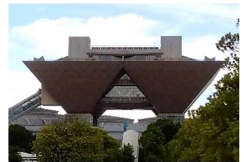
1日目は東京ビックサイト 国際会議場（7F）