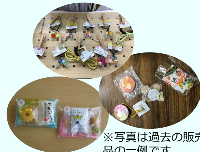
※写真は過去の販売品の一例です

1977年に16カ所の共同作業所によって結成。就労系事業をはじめ、障害のある人が生きていく上で関わる全ての事業を対象に1780カ所以上の事業所が加盟している。2014年度から「あたりまえに働き えらべる暮らしを～障害者権利条約を地域のすみずみに～」を新たな結集軸のスローガンとして掲げ、障害者権利条約に基づいた法整備がなされ、障害のある人たちへの理解が社会に広く浸透し根付くことで、障害のある人たちが安心して地域生活を送れることをめざし活動が続けている。