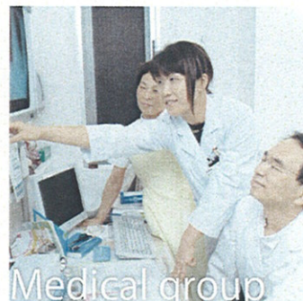
Medical group チーム医療