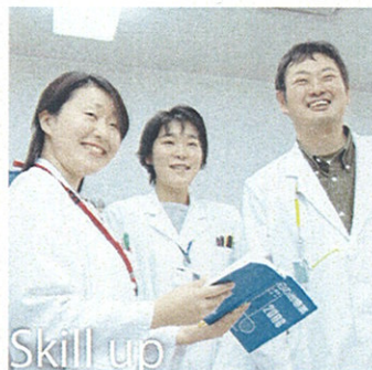
Skill up 成長