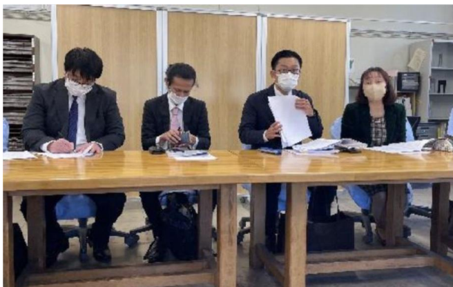
2/27(木) 宮日新聞の記事