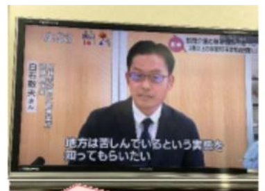
2/26(水)14:50からの MRT ニュースで報道

2月26日(水)、宮崎民医連など事業者団体で構成される宮崎市訪問介護事業者連絡協議会で、昨年5月と10月に実施した訪問介護事業所アンケート調査の結果報告の記者会見を行いました。調査結果を受け、連絡協議会として訪問介護の基本報酬の見直しなどを求める請願を県議会へ提出する予定です。請願書では、地方の条件不利地域の実態を踏まえ、持続可能な経営が行えるように支援を求めています。