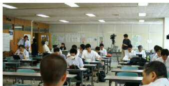
新聞7社、TV4局、他2社が取材。関心の高さを伺わせた