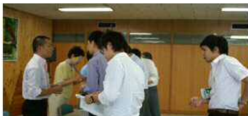
記者会見終了後、発言者に個別取材が殺到