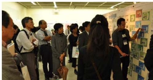
歯科学運交の ポスターセッションの様子

ポスターセッション時に、何か展示をしたい方は必ず事前に申し込みをお願い致します。(1月21日)までに事務局へお知らせ下さい。机、椅子などを準備致します。当日の申し出では対応できませんので、ご注意ください