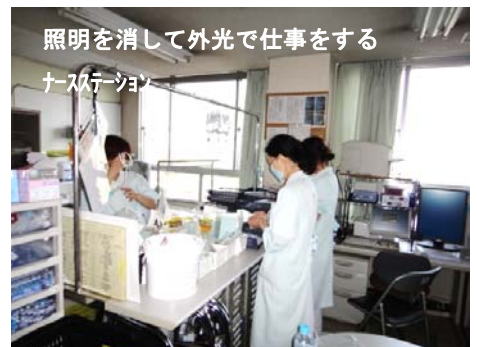
照明を消して外光で仕事をする ナースステーション

また流山市から連絡があり、被災地相馬市の患者10人受け入れてほしいとの相談を受けました。紹介状等がなくても救急外来で受けるよう院内で対応しています。