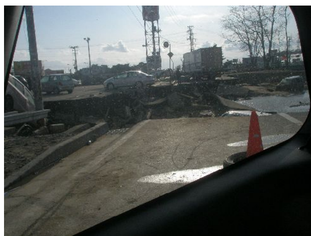
地震の影響で道路が寸断（帰路の途中）

宮城民医連歯科復興に向けて協議を開始します 民医連歯科のみなさんのご支援・ご協力をお願いします！