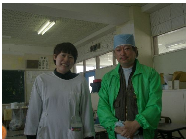
駒形所長と小玉衛生士