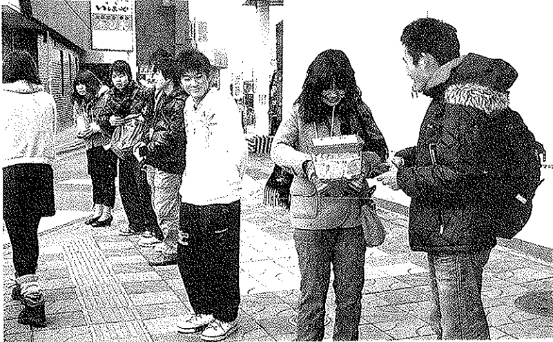
募金を呼び掛ける学生たち。津駅で。

東日本大震災の復興に向け、県内の大学生らが十四日、津駅前などで募金への協力を呼び掛けた。「被災地のために何かしたい」と三重大の学生たちがメールやツイッターで参加を募った。同大や県