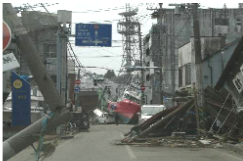
漁船が街の中まで押し流されてた