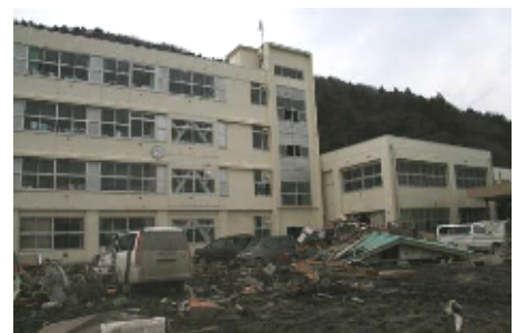
避難所の湊小 残骸は残ったまま