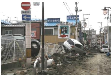
町内は少しずつ片付けが始まった