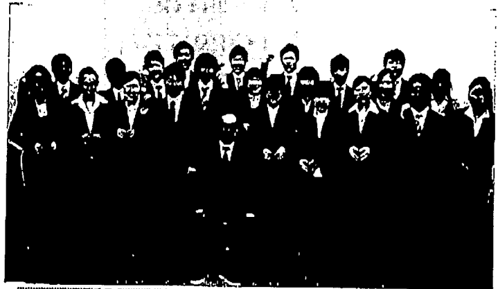
男性はガッツポーズ、女性は医療福祉生協連のシンボルマークのハートの形を作って記念写真

今年度4月採用の新入職員23人のオリエンテーションが行われました。震災の影響で参加する新入職員も準備する側も困難な中、現在別の職場に勤務している1人をのぞいて全員参加で行うことができました。6次長期計画初年度の新入職員として、また災害復興という医療生協運動の新たな課題を担う新入職員として、決意を固めました。