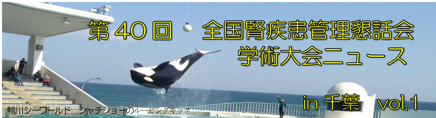
鴨川シーワールド シャチショーのレーピングキック