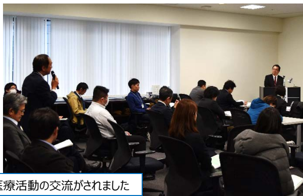
演題発表では活発な医療活動の交流がされました