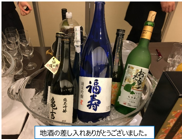
地酒の差し入れありがとうございました。