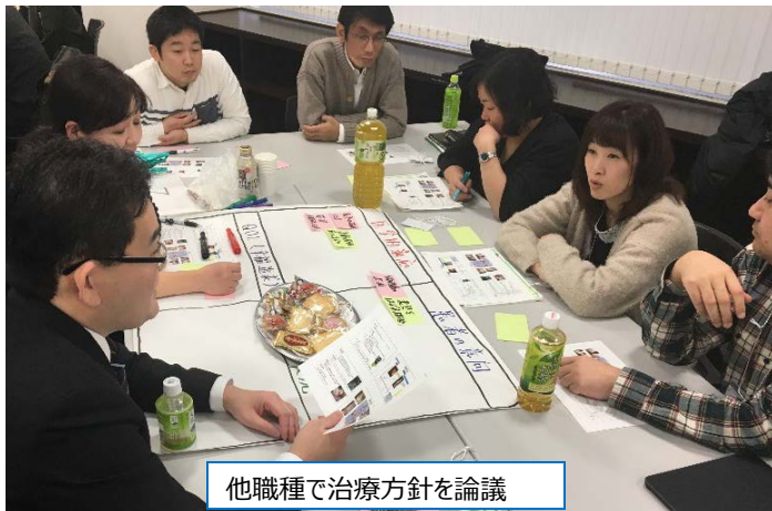
他職種で治療方針を論議