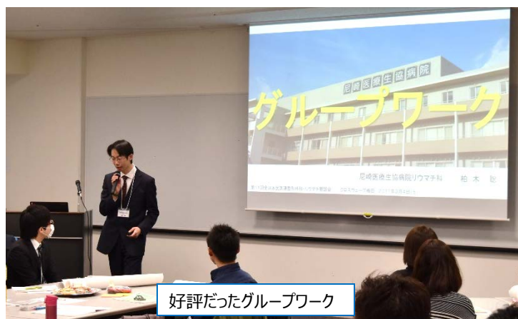
好評だったグループワーク