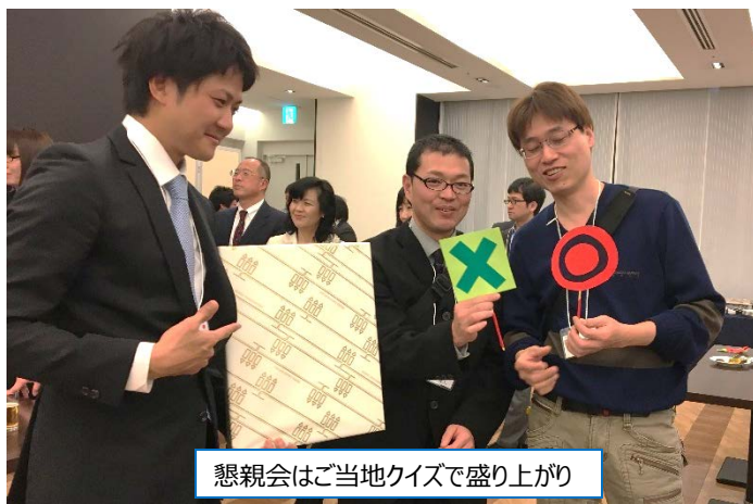
懇親会はご当地クイズで盛り上がり