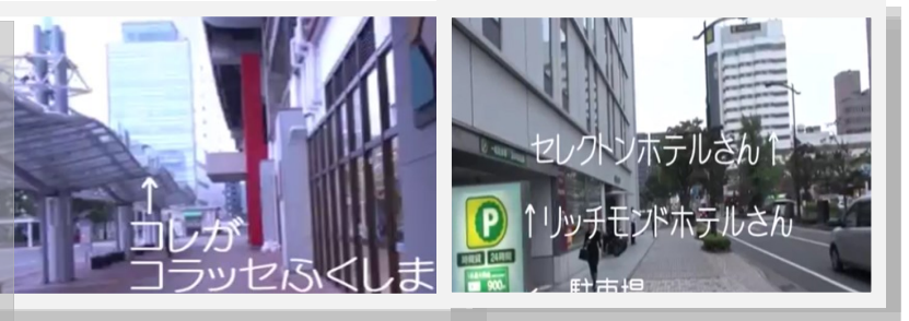
「JR福島駅西口から コラッセふくしま までの案内動画」