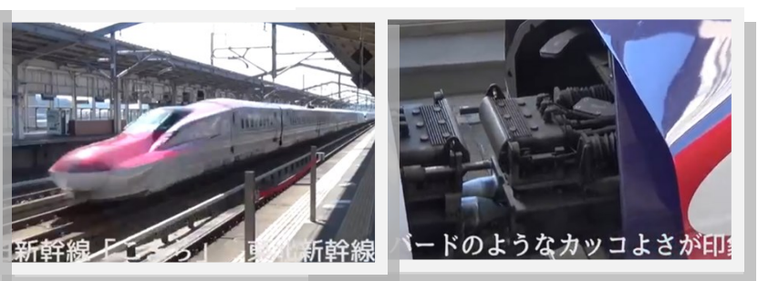
「たけしと福島の新幹線 ～までいの心は、線路を超えて～」