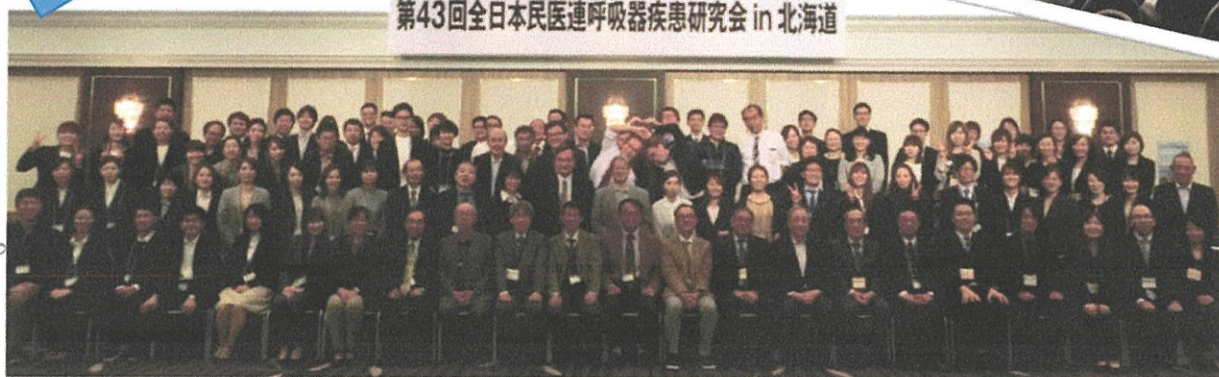
第43回全日本民医連呼吸器疾患研究会 in 北海道