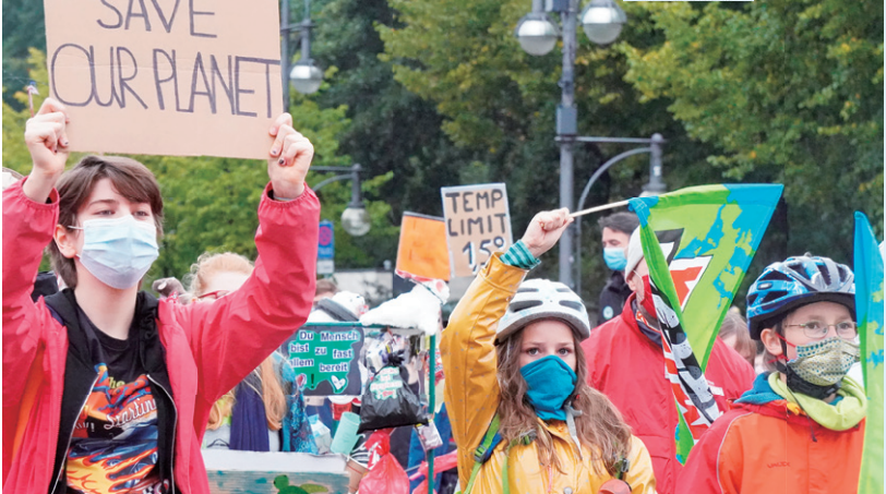
「私たちの地球を守ろう」プラカードをかかげる参加者＝2020年9月25日、ベルリン気候変動対策を求める若者の運動「未来のための金曜日」が呼びかけた世界一斉行動日